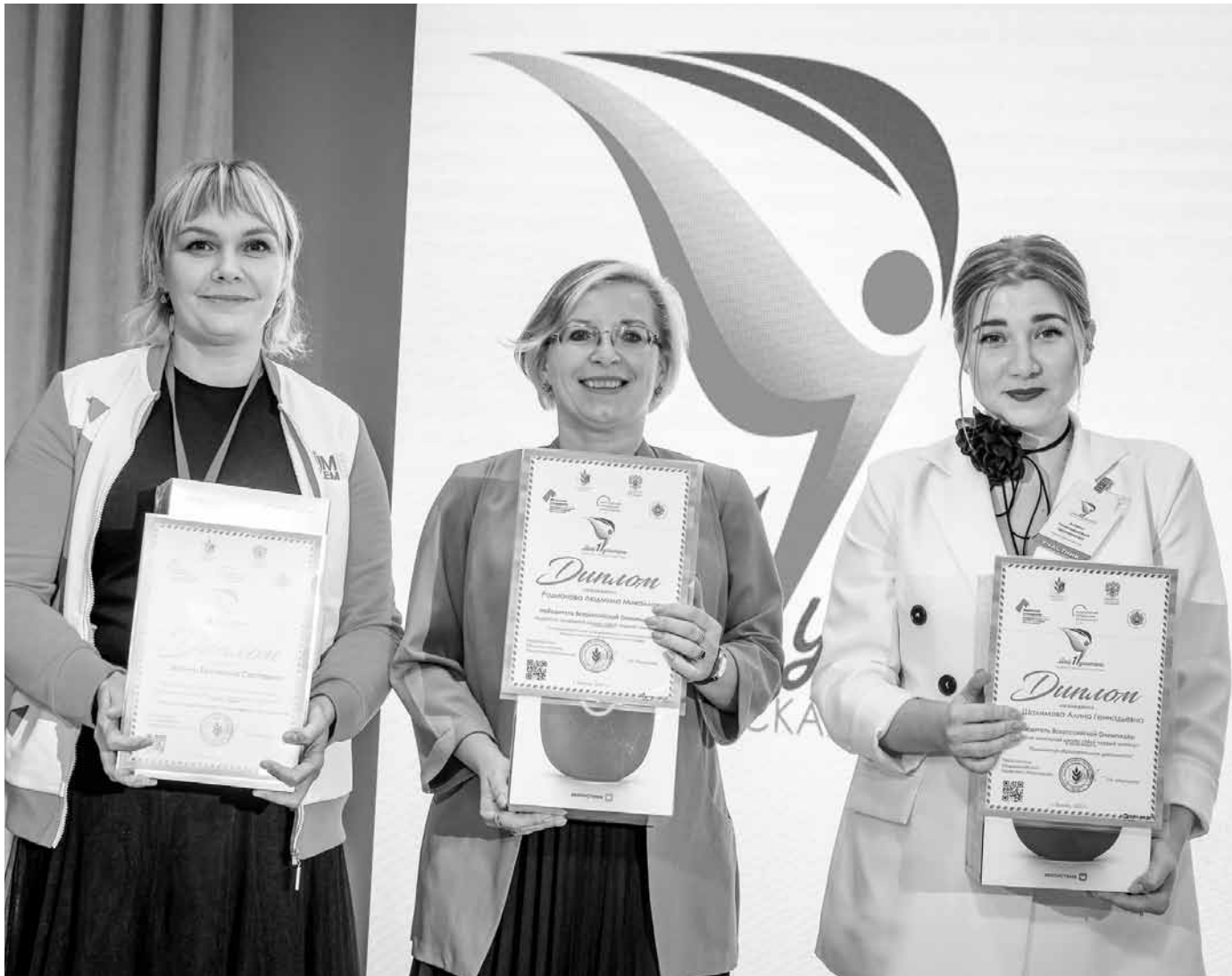
Победители олимпиады «Мой первый учитель»

Преподаватели начальных классов подружались на олимпиаде