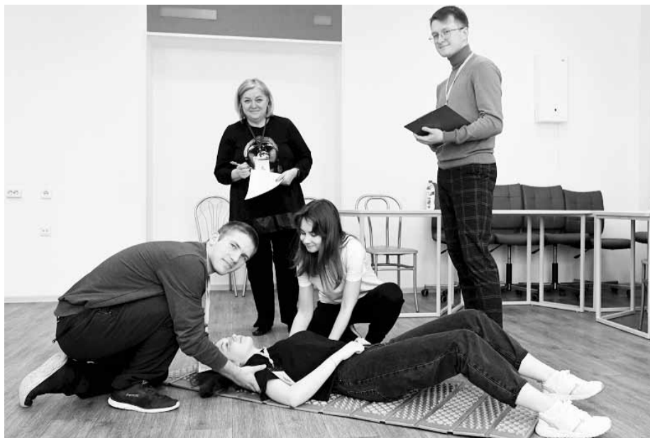
Педагоги демонстрировали не только теоретические знания, но и практические навыки