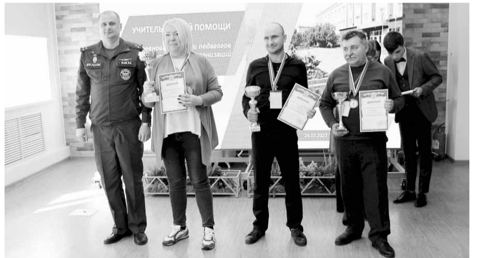
Победители соревнований «Учитель первой помощи»